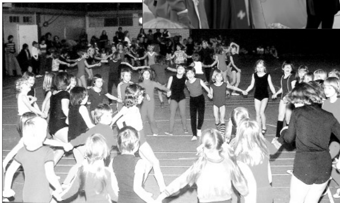
Rückblick: Weihnachtsfeier 1976 in der Turnhalle am Goldfischteich.