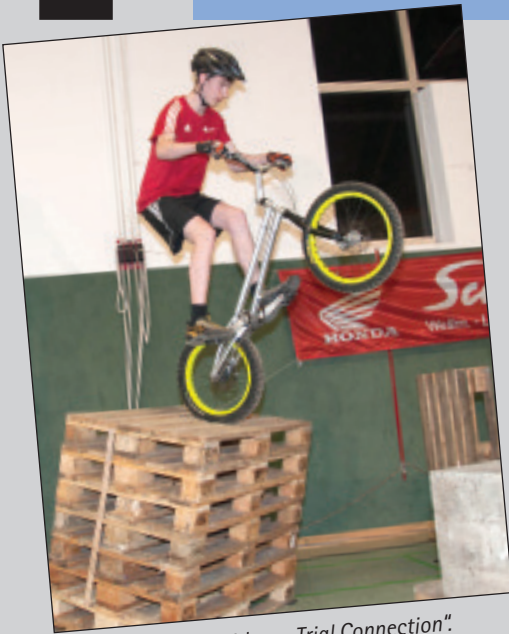
Akrobatik auf zwei Rädern: „Trial Connection“