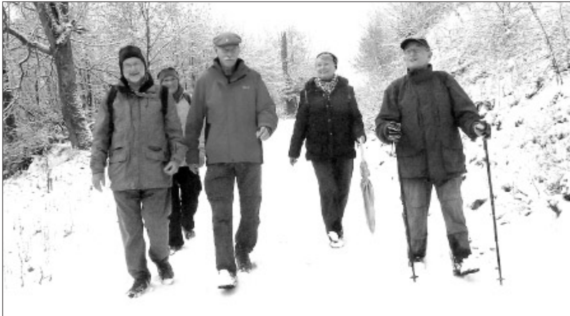
Auf dem Weg nach Blasbach: So stellt man sich ein Nikolauswetter vor!

Am 19. Januar trafen wir uns um 19.00 Uhr in großer Runde im Restaurant „Wöllbacher Tor“ zur Abteilungs-Versammlung mit Auszeichnungsfeier und Jahresrückblick mit schönen farbigen Fotografien unserer Wanderfotografen auf der dafür extra aufgestellten großen Leinwand. Das war wieder ein sehr gelungener, fröhlicher Abend und es hat sich jeder Wanderer und jede Wanderin gefreut, wenn sie sich auf der Leinwand gesehen haben