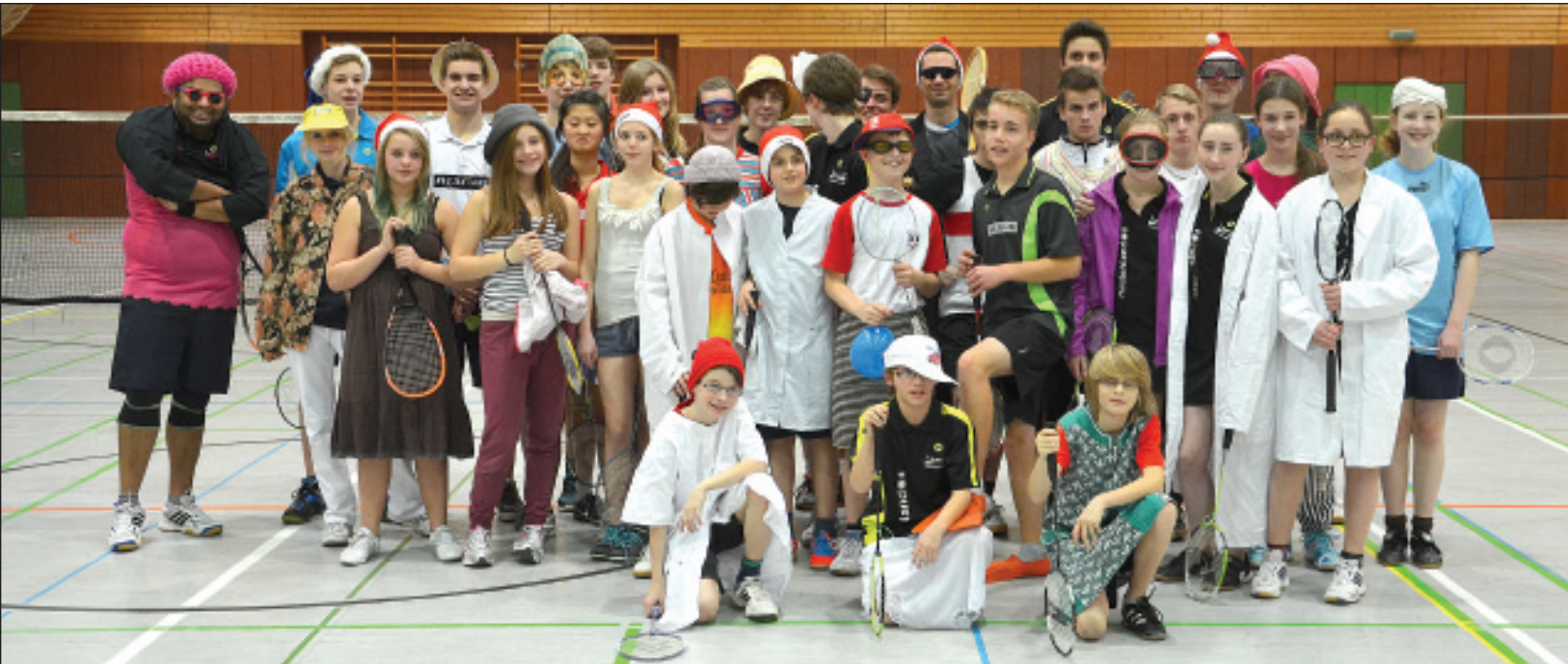
Beim Jux-Turnier der Badminton-Abteilung hatten alle wieder sehr viel Spaß.