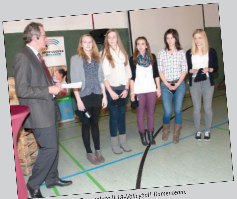
Nicht ganz vollständig: Das geehrte U 18-Volleyball-Damenteam.