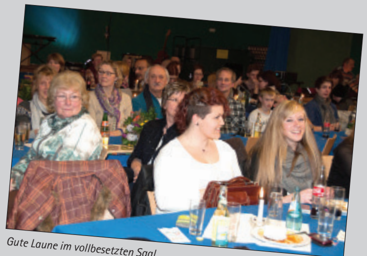
Gute Laune im vollbesetzten Saal..