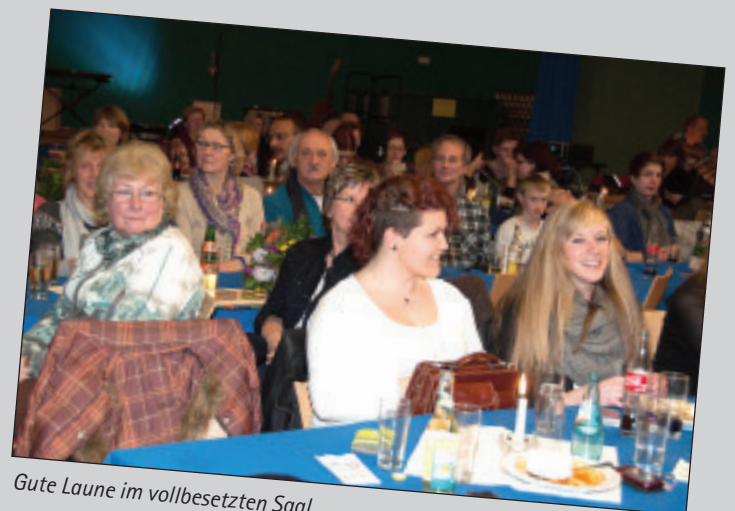
Gute Laune im vollbesetzten Saal..