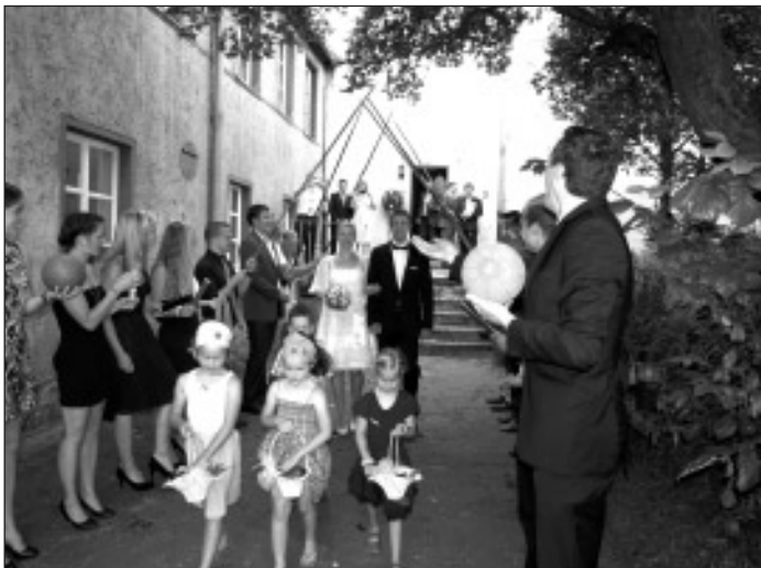
Die Leichtathletikabteilung stand Spalier

Euch beiden ein dickes Dankeschön für diese tolle Hochzeit und für Eure gemeinsame Zukunft wünscht euch die Leichtathletikabteilung viel Spaß, Erfolg und Glück.