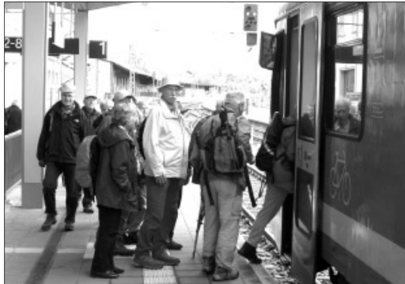
Burgwald: Mit der Edertalbahn in den Burgwald.

Die erste Rucksackwanderung des Jahres 2013 führte uns auf den