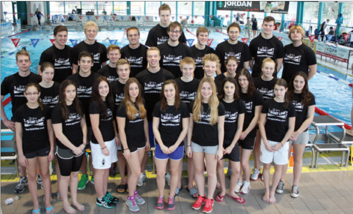
Das Wetzlarer DMS-Team Oberliga und Ladesliga Hessen.