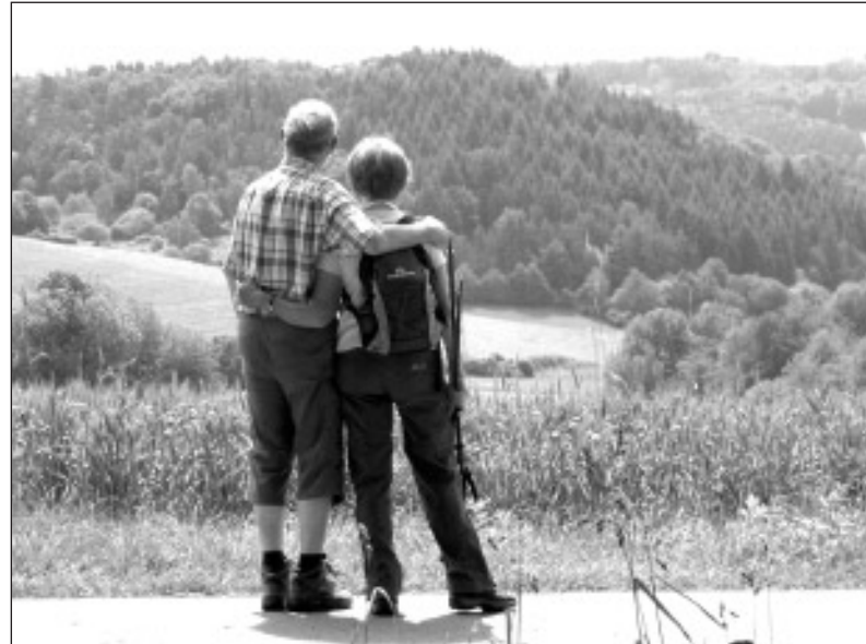
Panorama für Genießer.