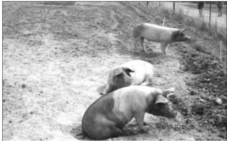
Waldsolms: Glückliche Bioschweine treffen auf Wanderer.