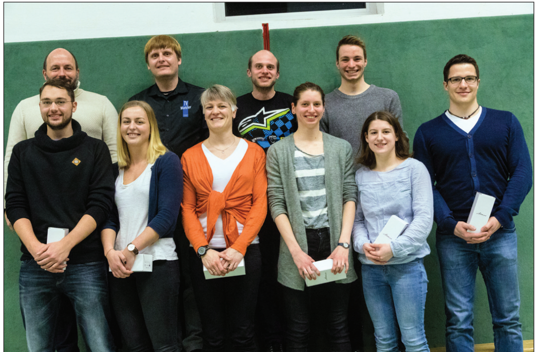
Die geehrten Aktiven des TV Wetzlar.