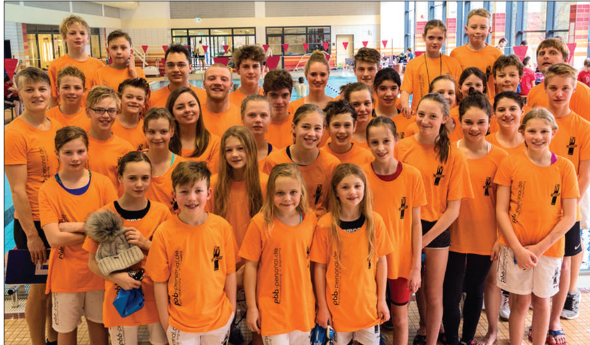
Das Wetzlarer Bezirksliga-Team Hessen West bei der DMS.