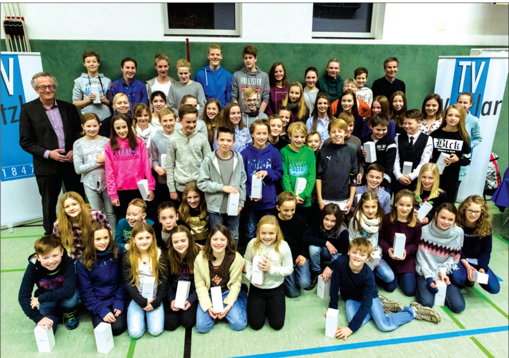
Aus der großen Schar der jungen Mitglieder ragten diese Schüler und Jugendlichen mit ihren Leistungen im letzten Jahr heraus.