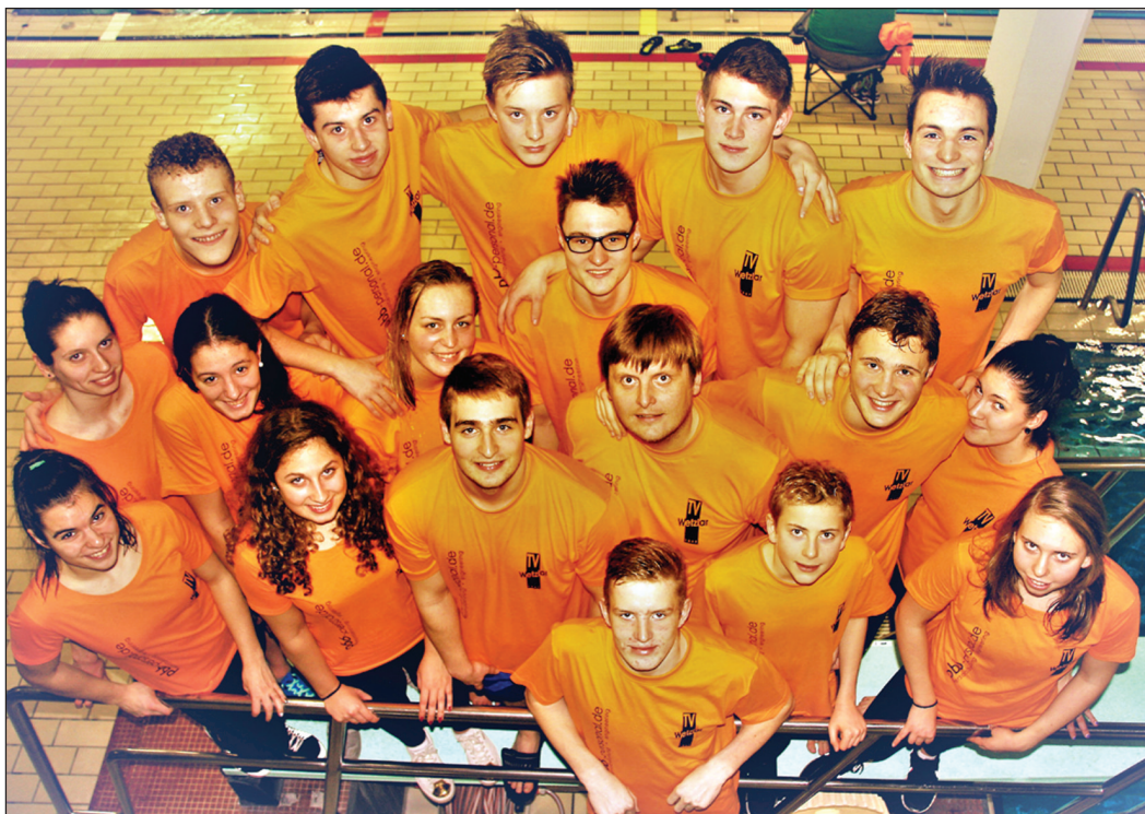
Das Wetzlarer Oberliga-Team Hessen West bei der DMS.

Den Bezirksmeistertitel und Aufstieg in die Landesliga Hessen haben die Herren des TV Wetzlar Herren III realisiert. Acht Akteure steuerten Punkte zum Gesamtergebnis von 10556 Zählern bei und waren damit das