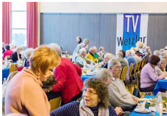
In der Kaffeepause gab es viel zu erzählen.