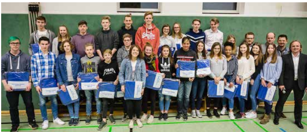
Für herausragende Leistungen in 2017 wurden zahlreiche TV-Jugendliche und ihre Trainer geehrt.

Textanlieferungen für die nächste Ausgabe bitte bis zum 11. Juni 2018.