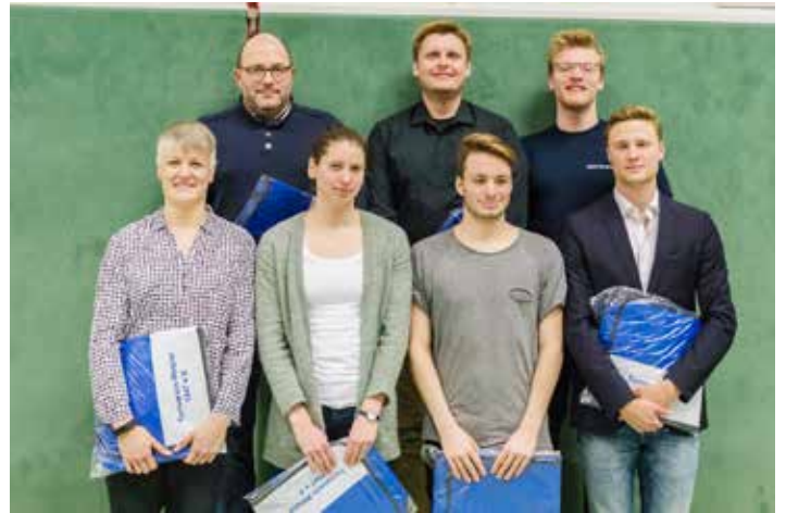
Diese Aktiven wurden für besondere Leistungen im vergangenen Jahr geehrt.