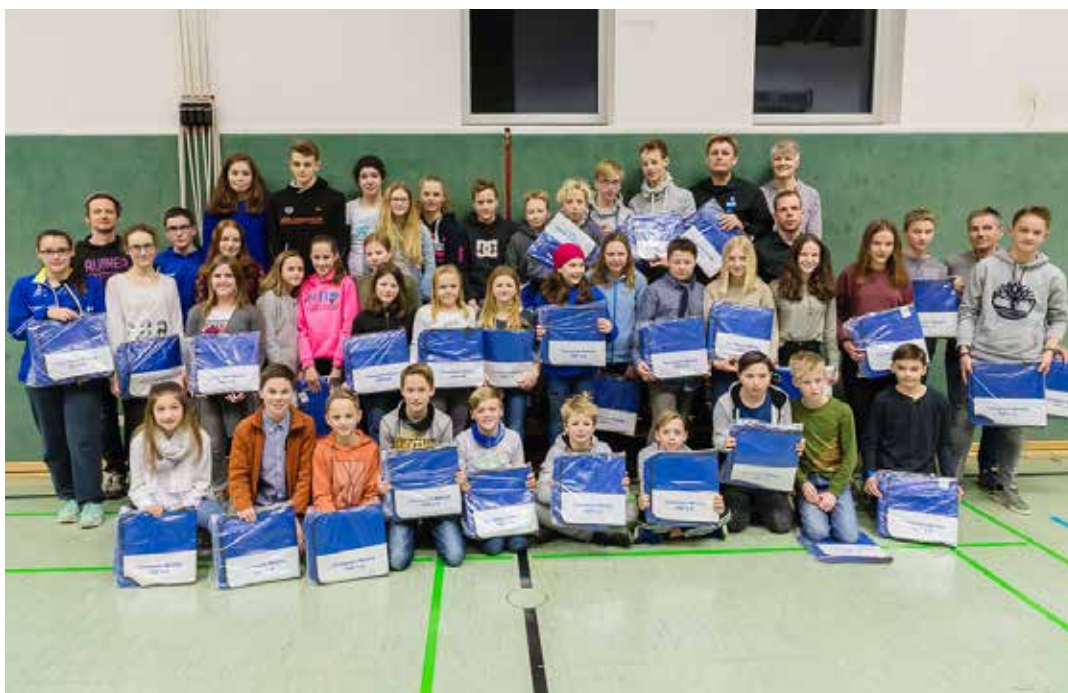
Auch die geehrten Schüler und ihre Trainer bekamen ein Präsent des TV für ihre besonderen Leistungen im letzten Jahr.