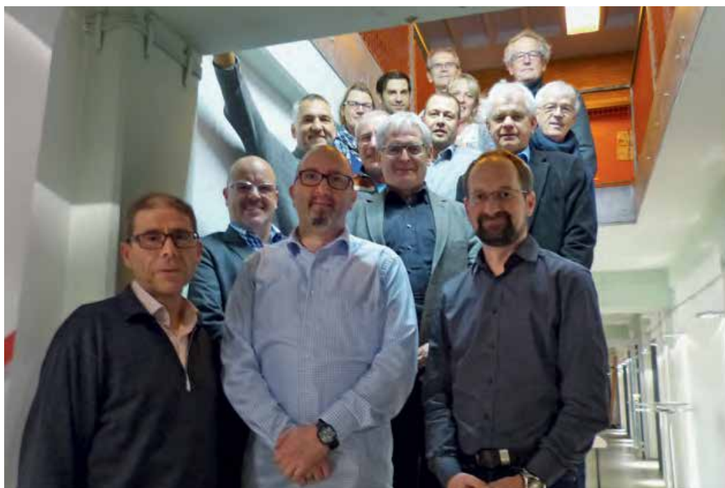
Netzwerk: Die Vertreter der hessischen Vereine mit mehr als 2.000 Mitgliedern.

Auf Wunsch der Vereinsvertreter wird der Landessportbund das Treffen der Großvereine 2018 auf eine Halbtagesveranstaltung ausweiten und damit noch mehr Möglichkeiten zum Austausch bieten. Ausrichter ist dann die SG Arheilgen, die ihr Konzept der Mitgliederbetreuung für Kleinkinder und Jugendliche vorstellen wird.