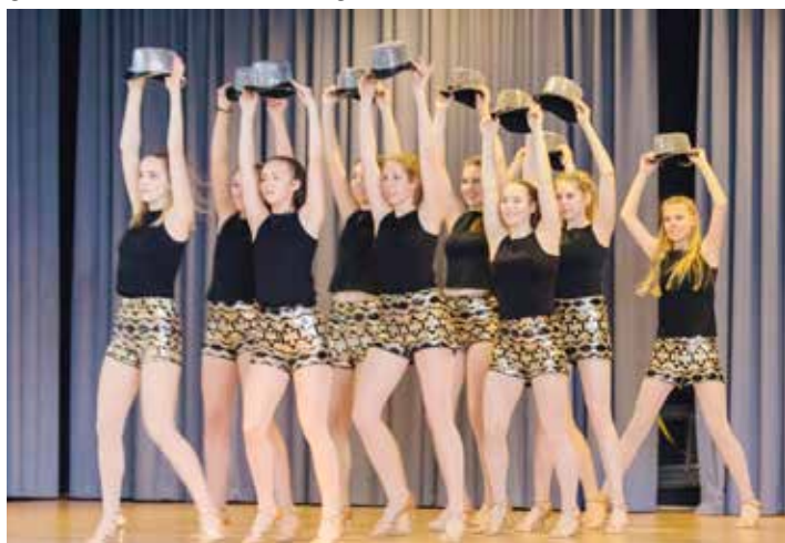
Im Rahmenprogramm begeisterte die TV-Tanzgruppe „Lumiere“.