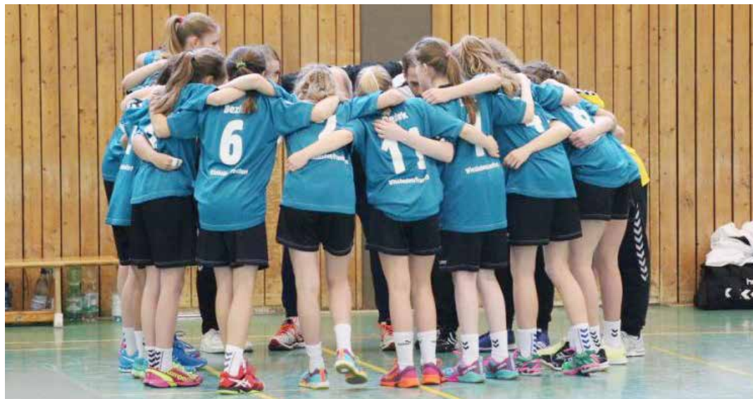
Die Auswahlmannschaft schwört sich auf die Partie ein.

Die Handballabteilung des TV Wetzlar hatte sich für die Ausrichtung des Turnieres beworben und hatte den Zuschlag