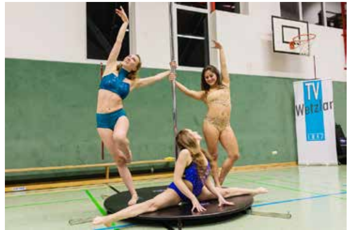
Ein sehr schönes Rahmenprogramm mit der Akrobatik-Show der Damen der TSG Blau-Gold Gießen.