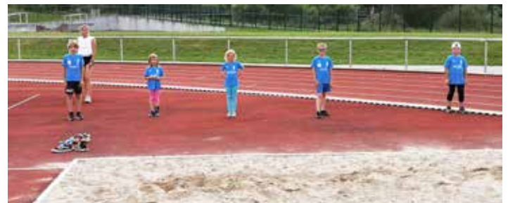
An der Sandgrube wird auf die Einhaltung der Regeln geachtet.

Auf den Bildern sieht man einen Teil der Kinder „mit Abstand“ trainieren. Nun hoffen wir auf die Zeit nach den Sommerferien - mit dann wieder ganz normalem Training!?