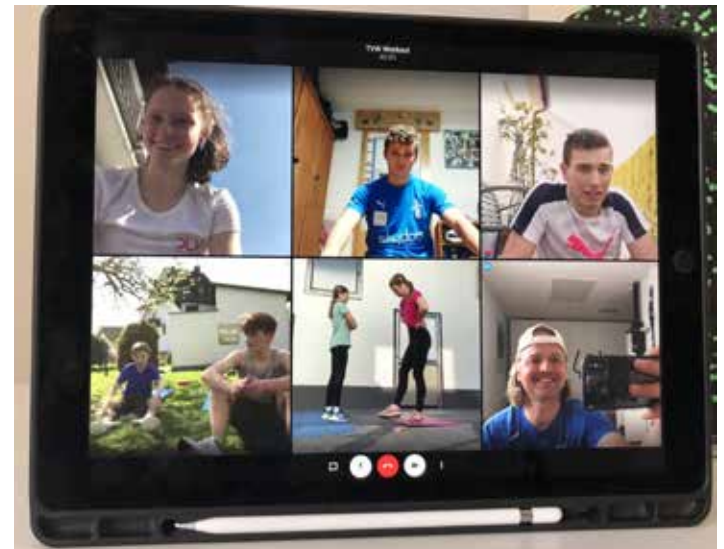
Workout in der Videokonferenz