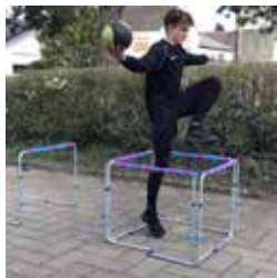
Hürdenquadrat im eigenen Hof