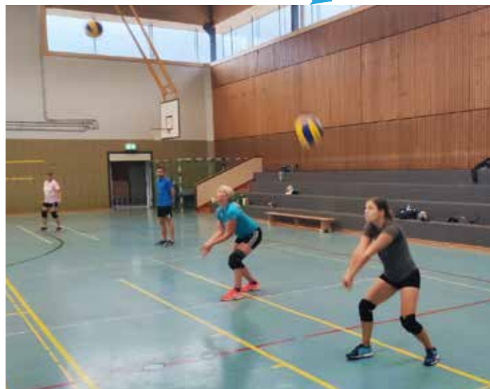
Volleyball Damen im Einsatz

Ab dem 12. Juni durften dann auch offiziell wieder mehr Personen (zehn – zwölf Personen) nach Empfehlung des HVV in einer Trainingsgruppe sein. Die Trainer passten demnach die Übungen an, und man konnte nun endlich auch wieder miteinander und gegeneinander spielen. Den Zwei-Schichten-Trainingsbetrieb behielten wir aber bis zu den Sommerferien bei. Die Findungsphase der neuen Mannschaften wird daher erst Anfang August erst wieder starten können, da wir da dann erst in das Einzel-Mannschaftstraining gehen können.