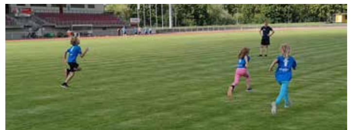
Die Kids rennen endlich wieder, wenn auch mit Abstand.