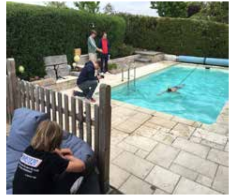
Mittelhessen.de filmt und berichtet über unser Schwimmtraining