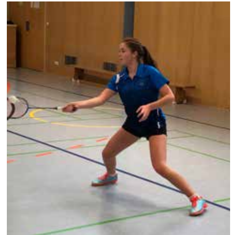
Erstes Training nach der Pause

um den angestrebten Aufstieg in die Hessenliga bangen. Auch die vierte Mannschaft des „BLZ“ konnte nicht mehr weiter um den Aufstieg von der Bezirksliga A in die Bezirksoberliga spielen. Nicht zuletzt musste die erste Mannschaft den Abstieg aus der Oberliga, der vierthöchsten deutschen Liga, fürchten.