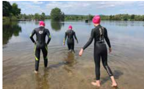
Schwimmen mit Neo

Alle Sportler hatten ab Mitte März das gleiche Problem: Sie konnten nicht mehr wie gewohnt trainieren. Die Schwimmbäder wurden geschlossen, sowie die Turnhallen. Am meisten Glück hatten noch die Leichtathleten und Läufer, da diese am besten draußen trainieren konnten. Das war aber auch bald vorbei, da es verboten wurde, in Gruppen zu trainieren, und so hatten alle Sportler ein Problem. So hieß es, eine Alternative zu finden. So bekamen wir Schwimmer Athletikübungen und die Aufgabe, allgemein Sport zu machen. Ab Mitte Mai durften sich dann wieder Grup-