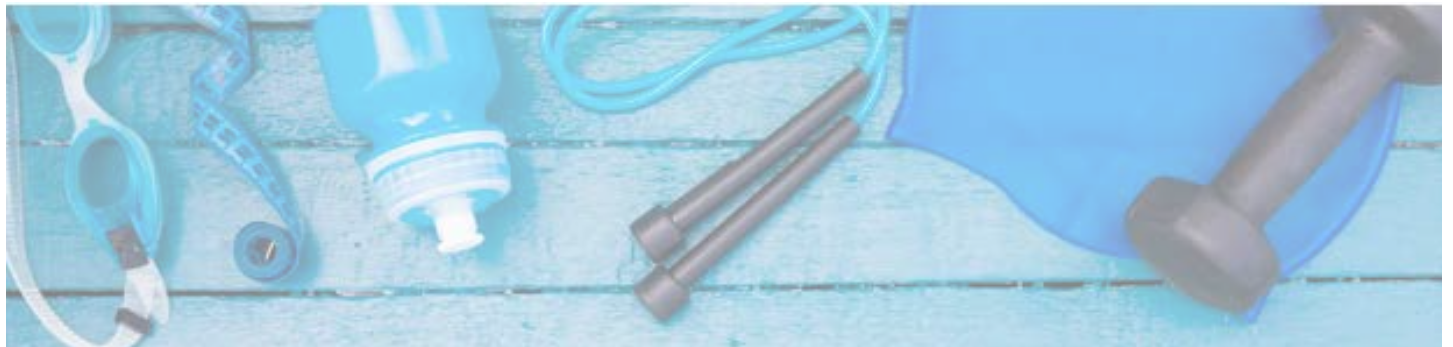
Vereinsrekorde TV Wetzlar 1847 Männer

Somit ließ sich die Zeit ohne Wassertraining in Wetzlar doch recht gut überbrücken, und ich freue mich, wenn wir wieder zur Normalität übergehen.