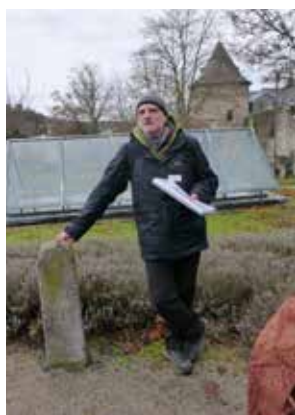
Unser jährliches Kulturwalken in der Vorweihnachtszeit: dieses Mal eine Grenzsteinführung und anschließendes gemütliches Kaffeetrinken im Gertrudishaus