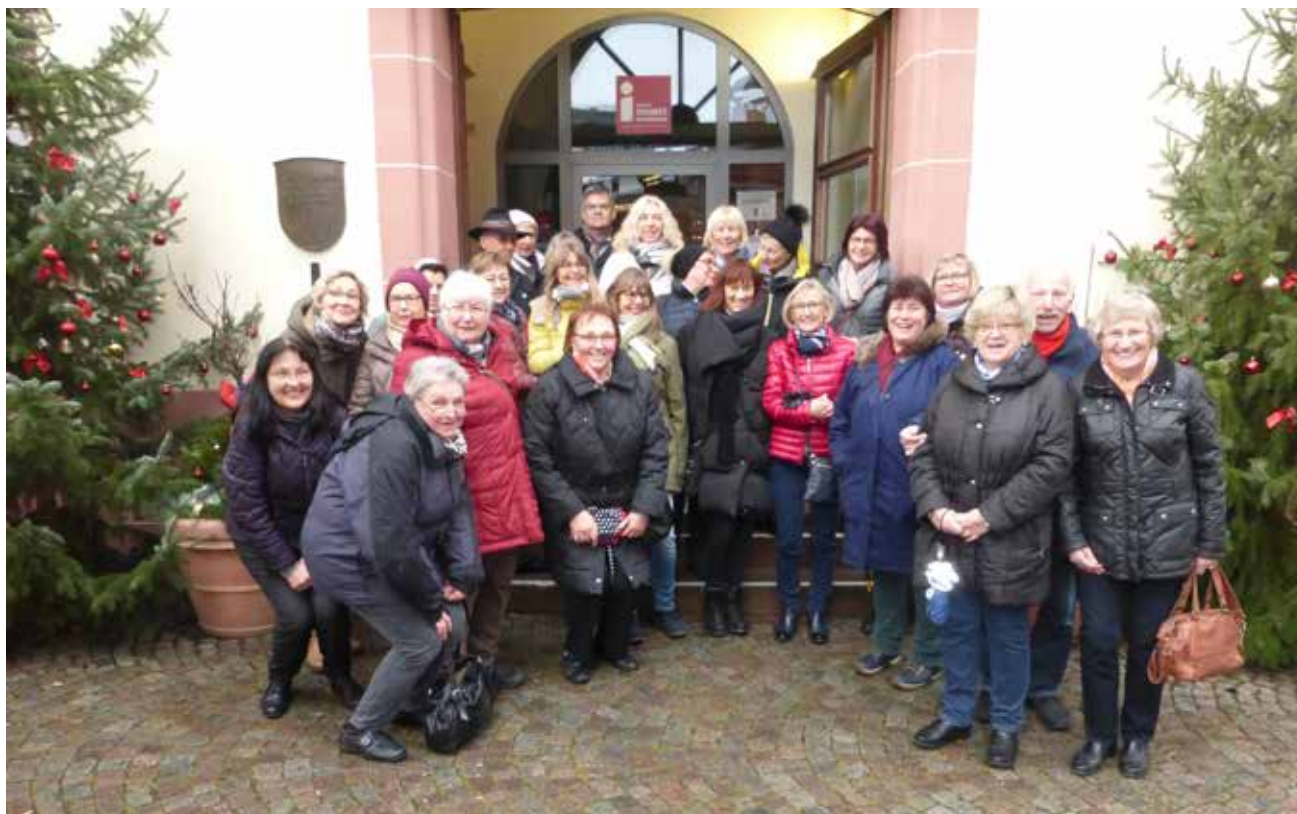
Gruppenbild vom Kulturwalken in der Vorweihnachtszeit: