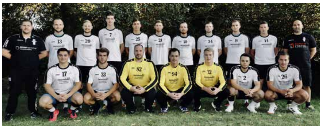
Auch in der kommenden Runde in der Bezirksoberliga vertreten. Die 1. Mannschaft des TV Wetzlar

Ein schräges Bild, das sich da zeichnet. Hatten die Handballer in den vergangenen Jahren immerzu dafür gesorgt, spielerisch den Klassenerhalt zu erzwingen, sicherte nun ein Virus in einer ausweglosen Situation den Klassenerhalt und lässt Wetzlars Handballer in eine fünfte Saison in der Bezirksoberliga gehen. Der Abstiegskampf wird sie sicherlich wieder begleiten. Doch diesmal soll der bitte wieder spielerisch gewonnen werden!