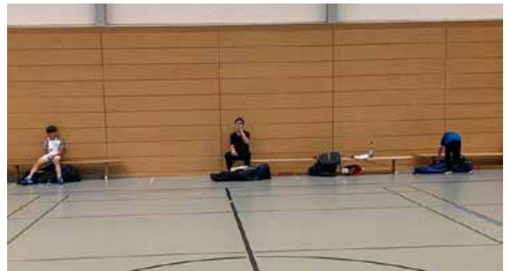
Abstand halten während der Pausen