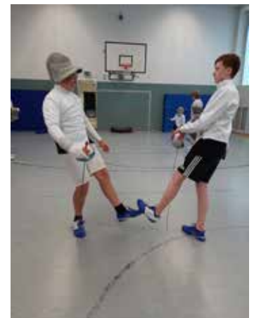
Fußgruß nach dem Gefecht

Am 11. Juni erfolgten schließlich weitere Lockerungen: es durfte auch wieder gegeneinander gefochten werden. Nach mehreren Wochen „nur“ Technik-Training freute sich jeder mal wieder auf ein „richtiges“ Gefecht. Nur das Abgrüßen - normalerweise per Handschlag - entfällt vorerst. Inzwischen hat sich in Fechterkreisen der „Fußgruß“ etabliert!