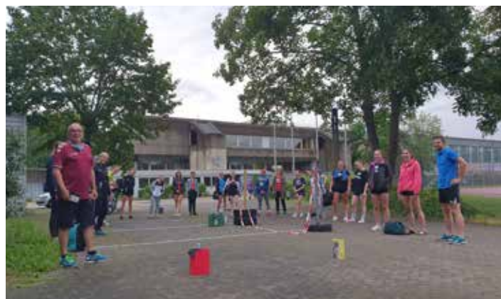
Danke an das Trainerteam

Zudem trainierten unsere kleinen „Großen“ (U12/U13)