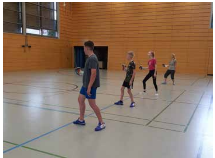
Abstand halten während des Trainings

„Fußgruß“ statt Handschlag Das Gefecht gegeneinander war anfänglich noch nicht erlaubt, daher konnten zunächst nur Beinarbeit, Ausdauer, und Technikübungen durchgeführt werden. Die Sportler mussten die Halle mit Mundschutz betreten und auch wieder verlassen. In der Halle durfte der Mundschutz abgenommen werden. Jeder Sportler durfte