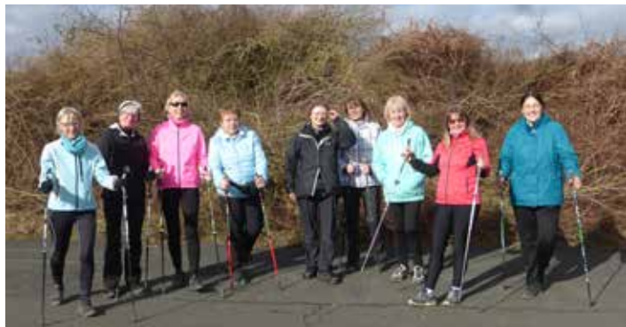
Und endlich ein „Beweisfoto“ unserer Walking-Aktivitäten bei strahlendem Sonnenschein

zahlreiche Aktionen, viel Spass und natürlich regelmäßiges Walken mit anregenden Gesprächen