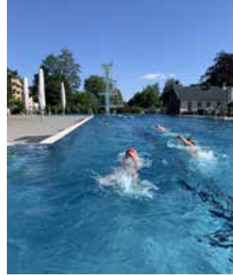
Freibad Geisweid in Siegen

deos in unsere Gruppen, um zu zeigen, was wir gemacht haben und um uns gegenseitig zu motivieren. Es wurden Rekorde für verschiedene Distanzen, die gejoggt oder mit dem Fahrrad gefahren wurden, aufgestellt, die immer wieder von besseren Zeiten oder Distanzen geschlagen wurden. Nach fast zwei Monaten konnten wir in kleinen Gruppen zusammen joggen, Fahrrad fahren und Athletiktraining machen. Nach