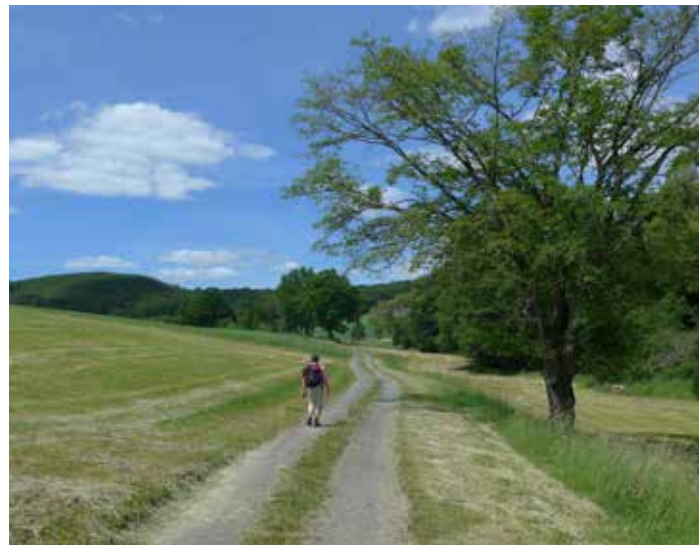
Lahn-Dill-Bergland bei Kirchvers

Unsere ersten Veranstaltungen bis zum 15. März – „Rund um den Stoppelberg“, Auszeichnungsfeier, „Grube Fortuna“ und „Braunfels“ – konnten wir noch wie geplant durchführen, doch wir wissen noch nicht, wann wir wieder gemeinsam wandern können. Wenn alles gut geht, sind wir vielleicht wieder im Juli un-