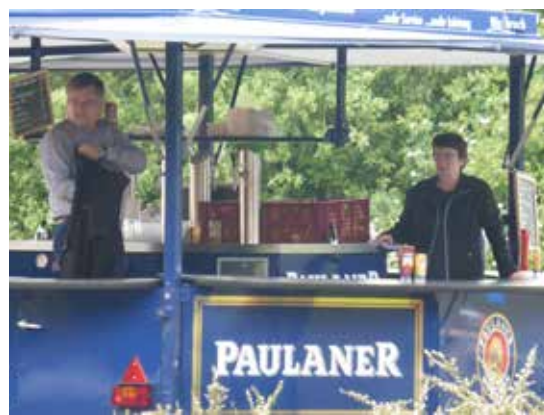
Wir unterstützen tatkräftig den TV-Familienstag mit dem Verkauf von Getränken und Speisen am Bierpils