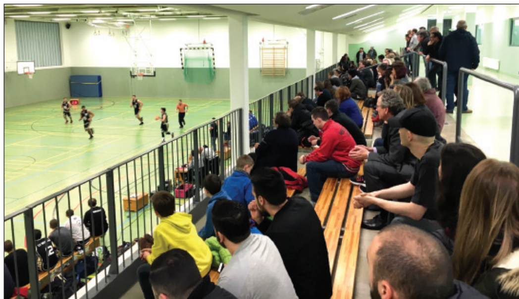
Gut besetzte Halle der Pestalozzischule beim Spitzenspiel gegen den TSV Langgöns.