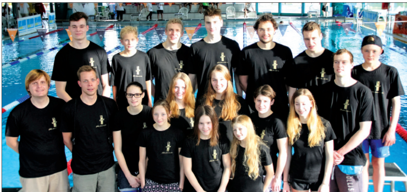
Das Team des TV Wetzlar bei der Landesliga in Baunatal.