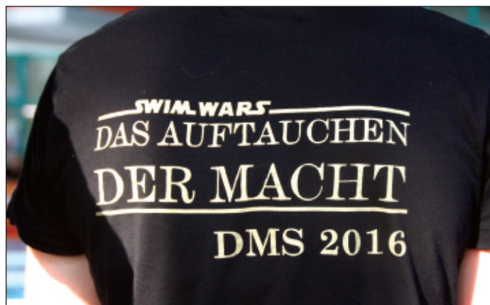
Das DMS-Shirt mit dem Motto für das Wochenende.

ermittelt. Zehn TV-Sportler/innen hatten im Vorfeld die Qualifikationsnormen unterboten und präsentierten die Vereinsfarben sehr erfolgreich. Mit einem neuen Bezirksrekord