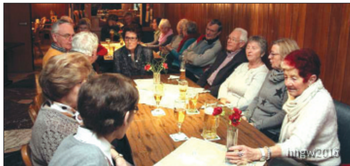
Die Abteilungssitzung und Feier waren gut besucht.

seine Entscheidung aufgenommen, zukünftig Karte und Kompass an den berühmten Nagel zu hängen. In po-