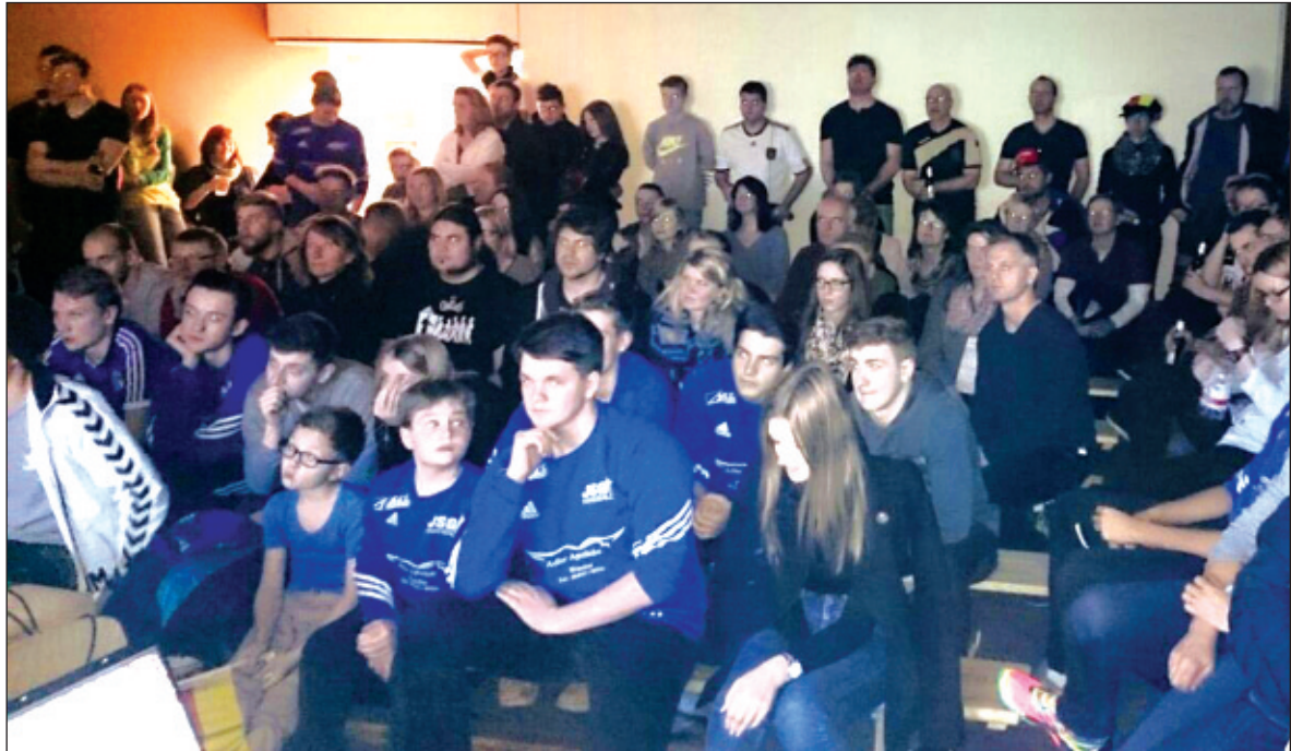
Ungläubiges Staunen bei Spieler und Fans im Foyer der Sporthalle der Eichendorffschule: Deutschland besiegt Spanien 24:17.

Es wären aber auch nicht die Handballer, wenn sie nicht in der Lage wären, aus der Not eine Tugend zu machen. Kurzerhand wurde der Termin neu organisiert und strukturiert. Dank sozialer Medien und dem guten alten Telefon wurde der Be-