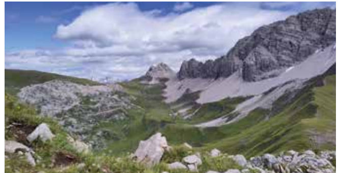
Auf dem Weg zur Stuttgarter Hütte