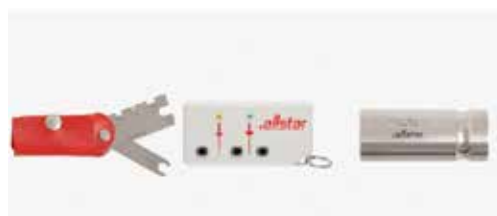
Quelle: Allstar Fechtausstatter Prüflehre, Prüfkästchen, Prüfgewicht 750 gr.