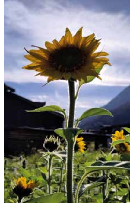
Beeindruckend ist der Standort.