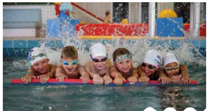
Nachwuchstraining beim TVW