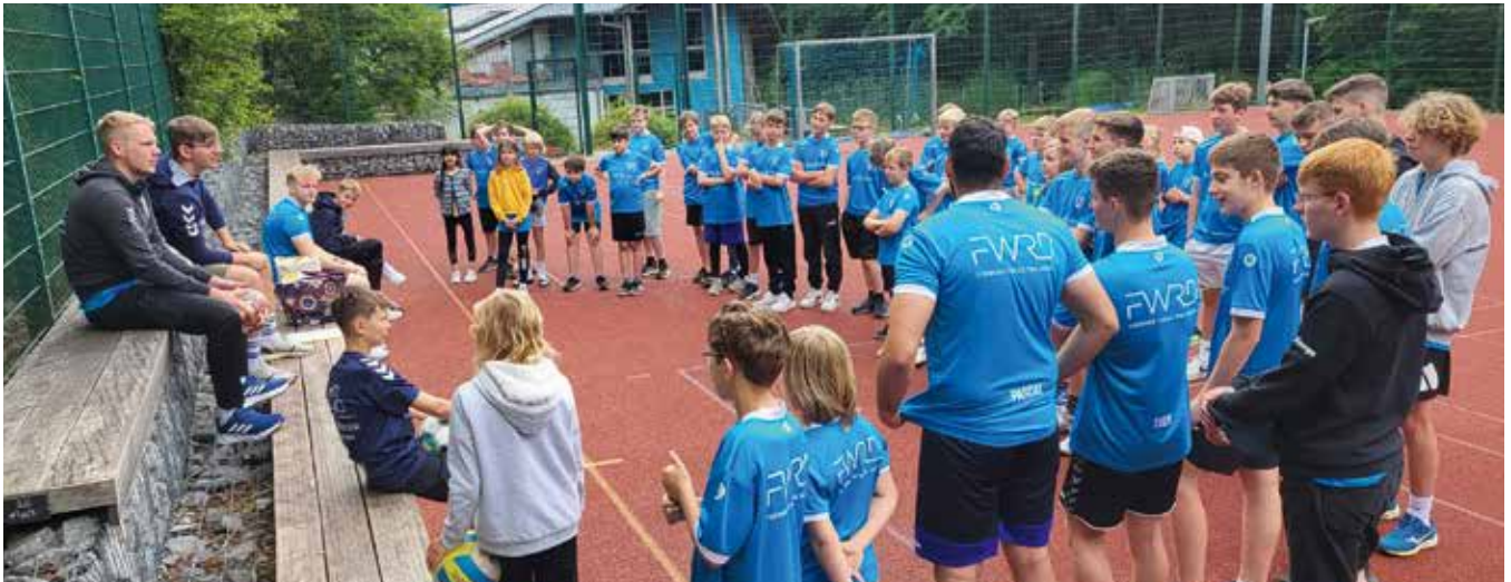
„Lagebesprechung“ oder auch: Kurze Pause für die Trainer.