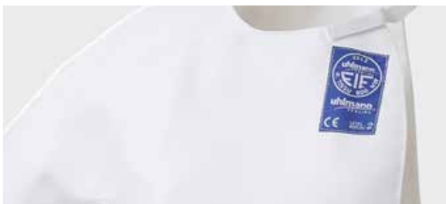
Das FIE-Prüfzeichen an einer Unterziehweste