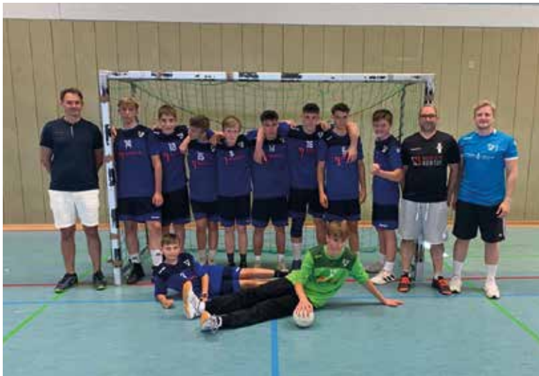
Spieler und Trainer der B-Jugend nach der erfolgreichen Qualifikation zur Bezirksbererliga.

und alle waren froh darüber, einmal etwas entspannter in die kommenden Trainingseinheiten starten zu können.