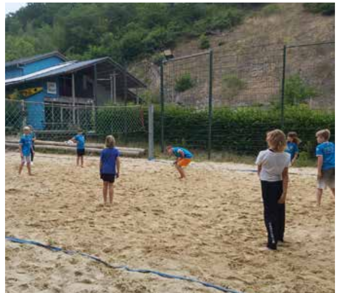
Die jüngeren versuchen sich beim Beachvolleyball.