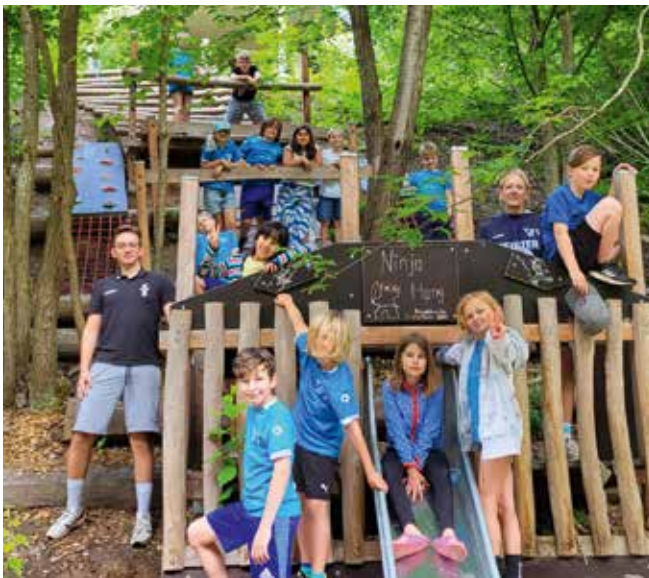
Ein Teil der Gruppe an einem Abschnitt des begehrten „Ninja-Parkours“.