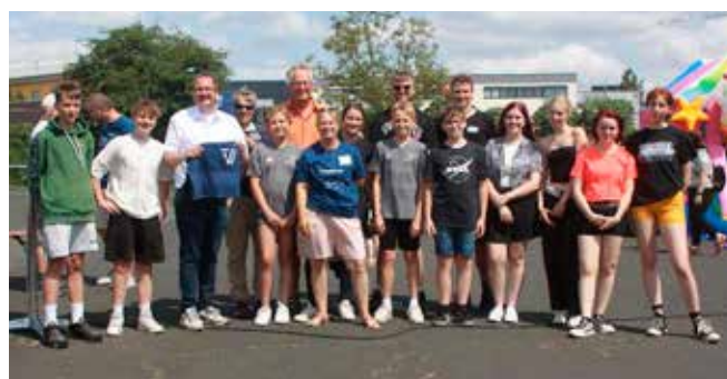
Alle haben Spaß!