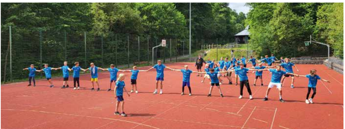
Die „Großen“ nehmen die Sache in die Hand und organisieren das Spiel. Beim Kettenfangen hatten alle ihren Spaß.