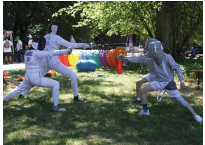
Im Wettkampf unmöglich, im Park möglich - Degen gegen Säbel