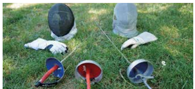
Säbel und Degenfechten im TV Wetzlar. Bitte vorbeikommen, anmelden und mitmachen!