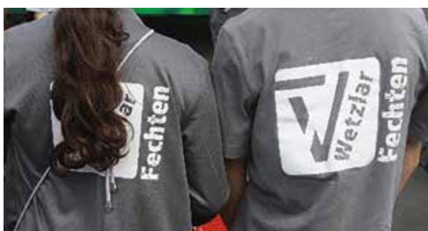
So übernehmen Mitglieder der Fecht- abteilung ein paar Supportdienste.

Kein Fest ohne die Fechtabteilung. Natürlich ist es Ehrensache, dass wir uns an den Aktionen zum Sommerfest des TV Wetzlar beteiligt haben. Die viele Arbeit, das Engagement der Haupt- und unzähligen Ehrenamtlichen, die eine solche Veranstaltung zum Erfolg führten, muss natürlich gewürdigt werden.